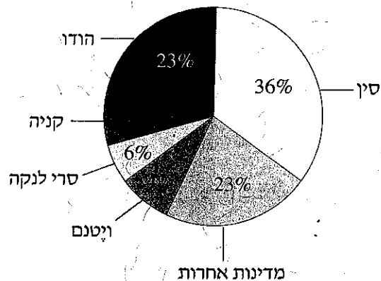
מדינות המגדלות תה (2013)

(מעובד על פי האתר www.en.wikipedia.org )