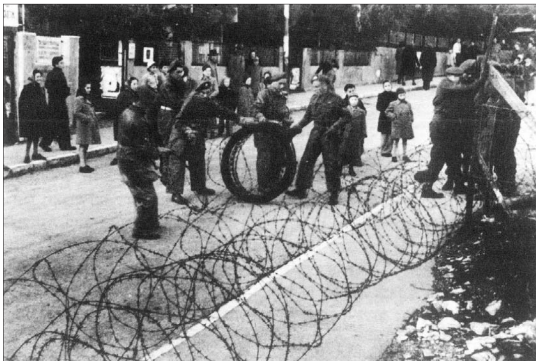
מ' נאור וד' גלעד, ארץ-ישראל במאה העשרים, משרד הביטחון, 1991, עמ' 377

תצלום 1 — ירושלים (סוף תקופת המנדט הבריטי)