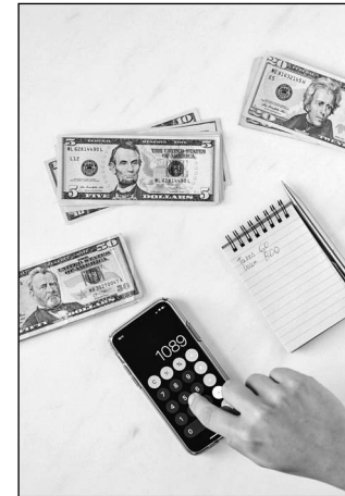
Managing Money and Time

15 IV Some people are lucky enough to learn these skills from their parents. But the only way to make sure that everyone learns them is by teaching them at school, in addition to the other subjects.