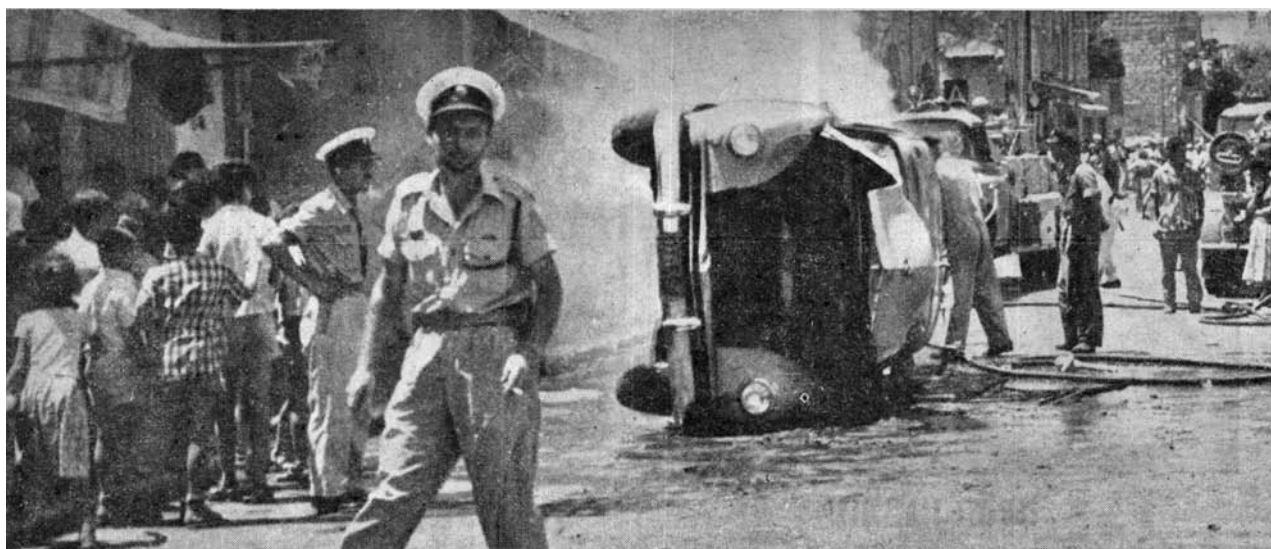
הכבאים מטפלים במכונית שנהפכה על ידי המתפרעים ועולה באש

כמה מאות יוצאי צפון אפריקה, תושבי שכונת ואדי סאליב בעיר התחתית בחיפה, ערכו במשך יום אתמול התפרעויות רציניות בתגובה על פציעתו של שיכור בן עדתם על ידי המשטרה. המתפרעים כילו את זעמם בחנויות ובמכוניות. 13 שוטרים נפצעו בהתנגשויות עם המתפרעים, ושלושה מהם נשארו בבית החולים לשם קבלת טיפול נוסף. [...]