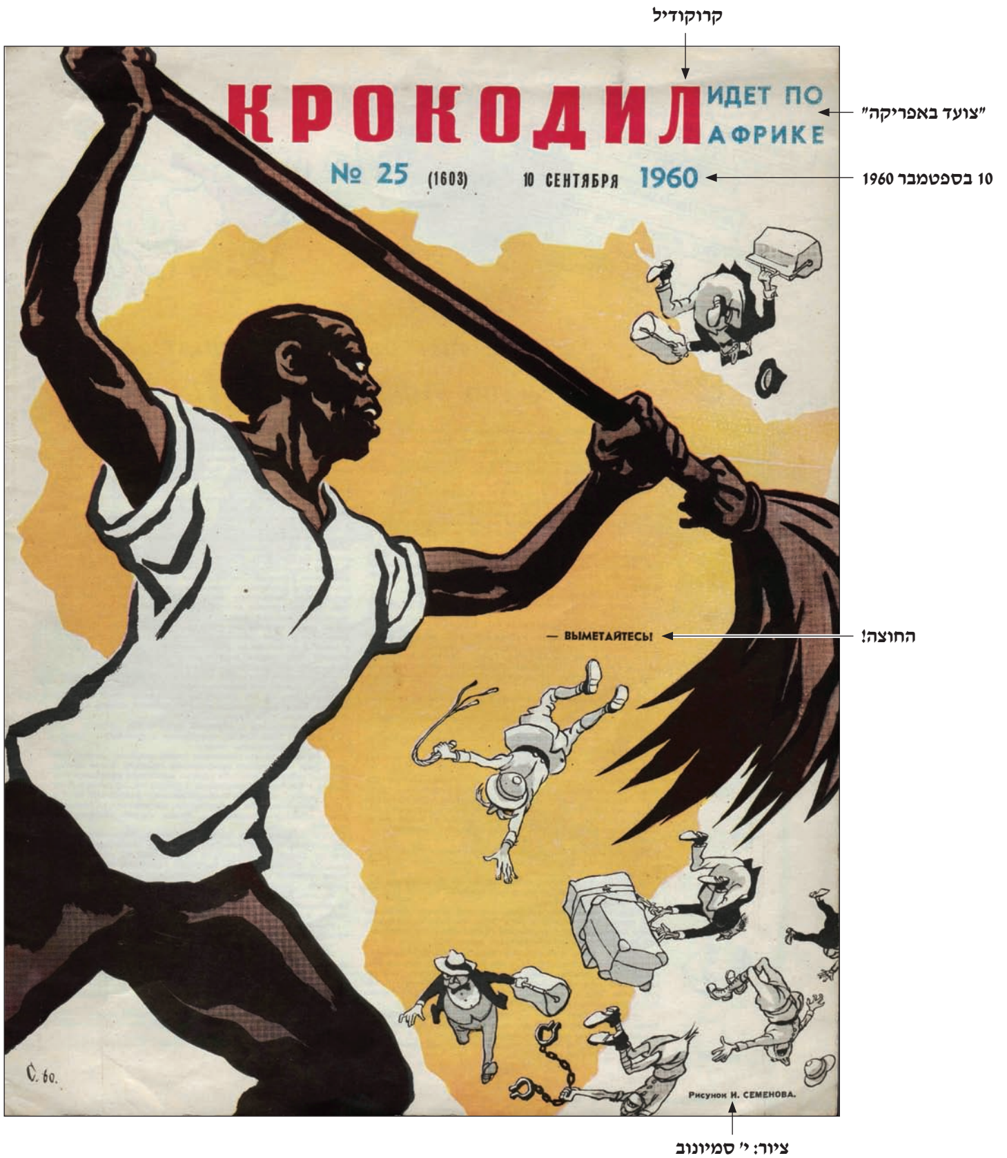
(קרוקודיל, גיליון 25, המפלגה הקומוניסטית של ברית המועצות, 10 בספטמבר 1960)