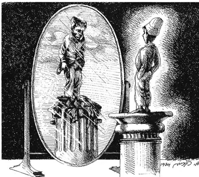
(דני קרמן, זה מה שיש!, זמורה-ביתן-מודן, 1981)

מקור 1 – קריקטורה מאת דני קרמן שפורסמה ב־1974