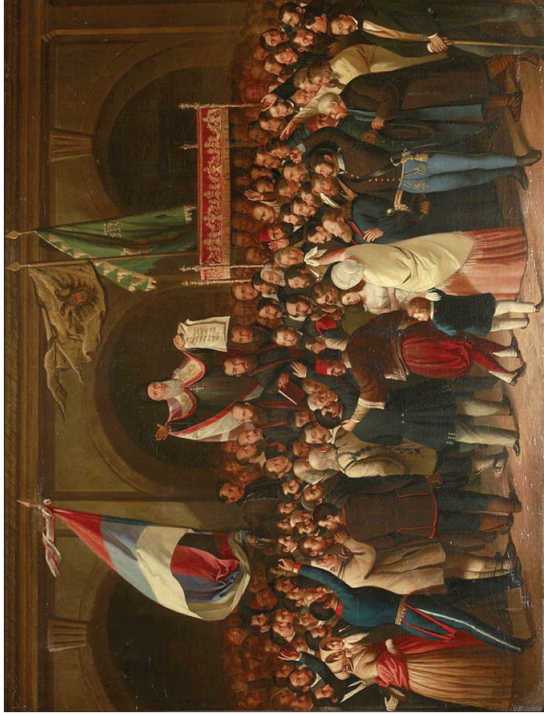
(ציר: פאול סימיו, Wikimedia Commons , Pavel Simić, by Wikimedia Commons )